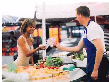
Afb. 1.30 Markt