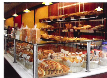
Afb. 1.31 Speciaalzaak