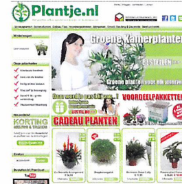
Afb. 1.34 Webshop

1.11 Wat is het grootste verschil tussen een tuincentrum en een webshop?