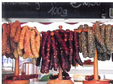
Afb. 1.29 Boerderijwinkel