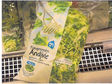
Afb. 1.32 Supermarkt