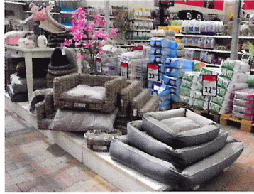
Afb. 1.33 Tuincentrum